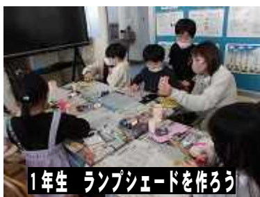
1年生 ランプシェードを作ろう

【2 / 1 6 (金) 学習参観・懇談会】 保護者の皆様にはお忙しい中ありがとうございました