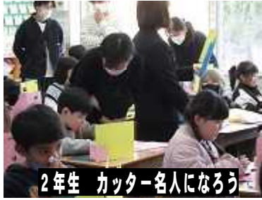
2年生 カッター名人になろう