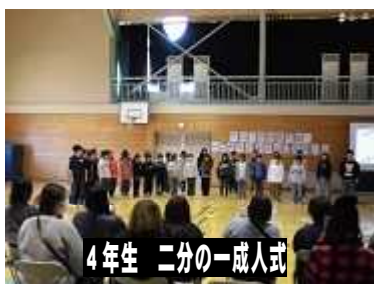
4年生 二分の一成人式