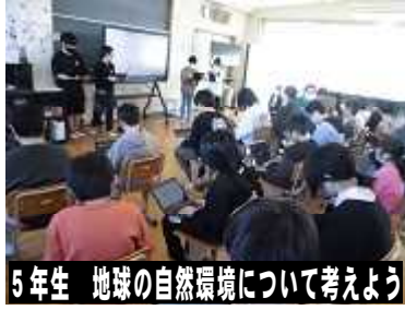
5年生 地球の自然環境について考えよう