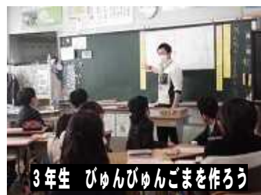
3年生 びゅんびゅんごまを作ろう