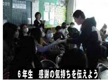
6年生 感謝の気持ちを伝えよう

【2 / 2 2 (木) なわとび大会】 時間跳びも大なわも全力でがんばりました